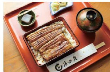
昼食は巴水ゆかりの清水屋でうな重をお楽しみいただきます(写真はイメージです)