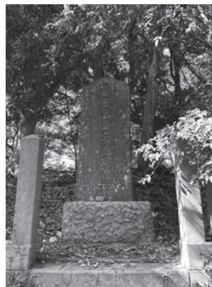
弁天塚古墳 (美浦村大塚)