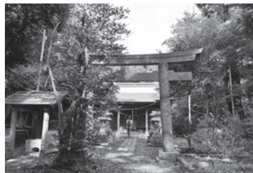
尾島神社 (稲敷市浮島)

『常陸国風土記』には、1,300年前の茨城の様子が記されており、古代の茨城に整備された村と村を結ぶ道、それらを支配する豪族の姿がうかがえます。『常陸国風土記』を読み解きながら、当時を偲ぶことができる推定東海道、集落遺跡、古墳などを訪ねます。