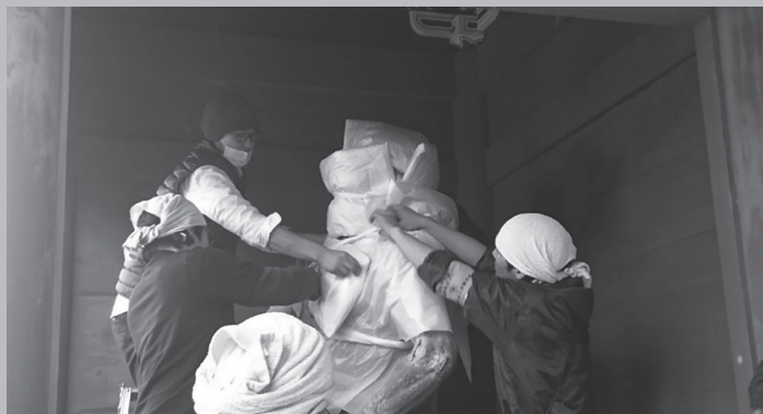
雨引山楽法寺仁王像搬出作業 / 東京藝術大学大学院美術研究科文化財保存学専攻保存修復彫刻研究室

仏師運慶と東国武士の関係を紹介し、それが八田知家を通して常陸国に及び、筑波極楽寺から周辺寺院に運慶様の作品が広がったことを明らかにします。 ※本誌16～17ページに関連記事を掲載しています